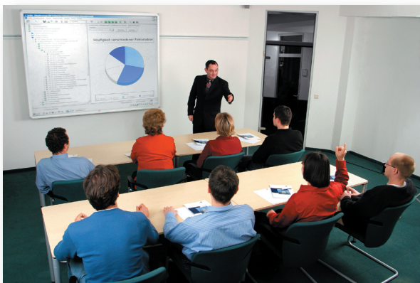
Abbildung 2: Keßler Solutions bietet umfangreiche Schulungen zu FAMOS ®

Ihr Garant für eine qualitativ hochwertige FM-Ausbildung: Keßler Solutions schult Ihre Dozenten bzw. die Teilnehmer Ihrer FM-Ausbildungsmaßnahme und macht diese mit der Software vertraut. Für die umfangreichen Schulungen zum System bietet Ihnen Keßler Solutions Sonderkonditionen an. Die Dauer der Schulungen bestimmen Sie selber, die Schwerpunkte werden vorher gemeinsam abgestimmt. Wählen Sie dabei aus folgenden Modulen aus: